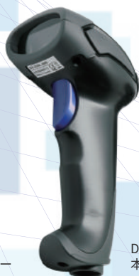
DS-2300 (BK) 本体カラー：ブラック