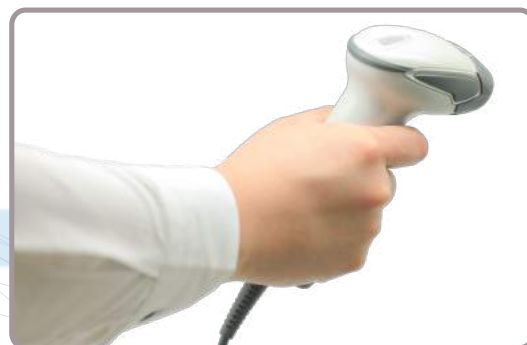
扱いやすいスマートなガンタイプ