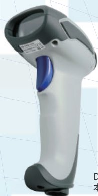
DS-2300 (LG) 本体カラー：ライトグレー

※1: USB (HID) モード時のみ設定が適用されます。 RS-232C、USB (COM) 接続の場合は、本製品 USB-COM ドライバーの ファイルに同梱されているキーボードシミュレーターを介す必要があります。