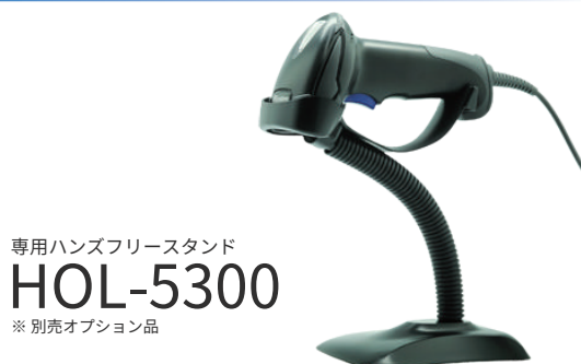
専用ハンズフリースタンド HOL-5300 ※ 別売オプション品