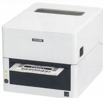
感熱タイプ EC320 / EC330