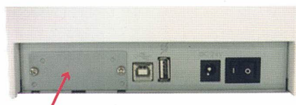
工場オプションで有線 LAN・無線 LAN やシリアルも追加可能

USB を標準装備しています。工場オプションでインターフェースボードを差し替えることにより、豊富なインターフェースが選択可能です。有線 LAN やシリアルはもちろん、無線 LAN(2.4G/5G)にも対応。ハンディターミナル、タブレット端末、スマートフォンからワイヤレスで印刷する際の使いやすさを実現しています。