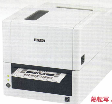
熱転写 / 感熱兼用タイプ EC320T / EC330T