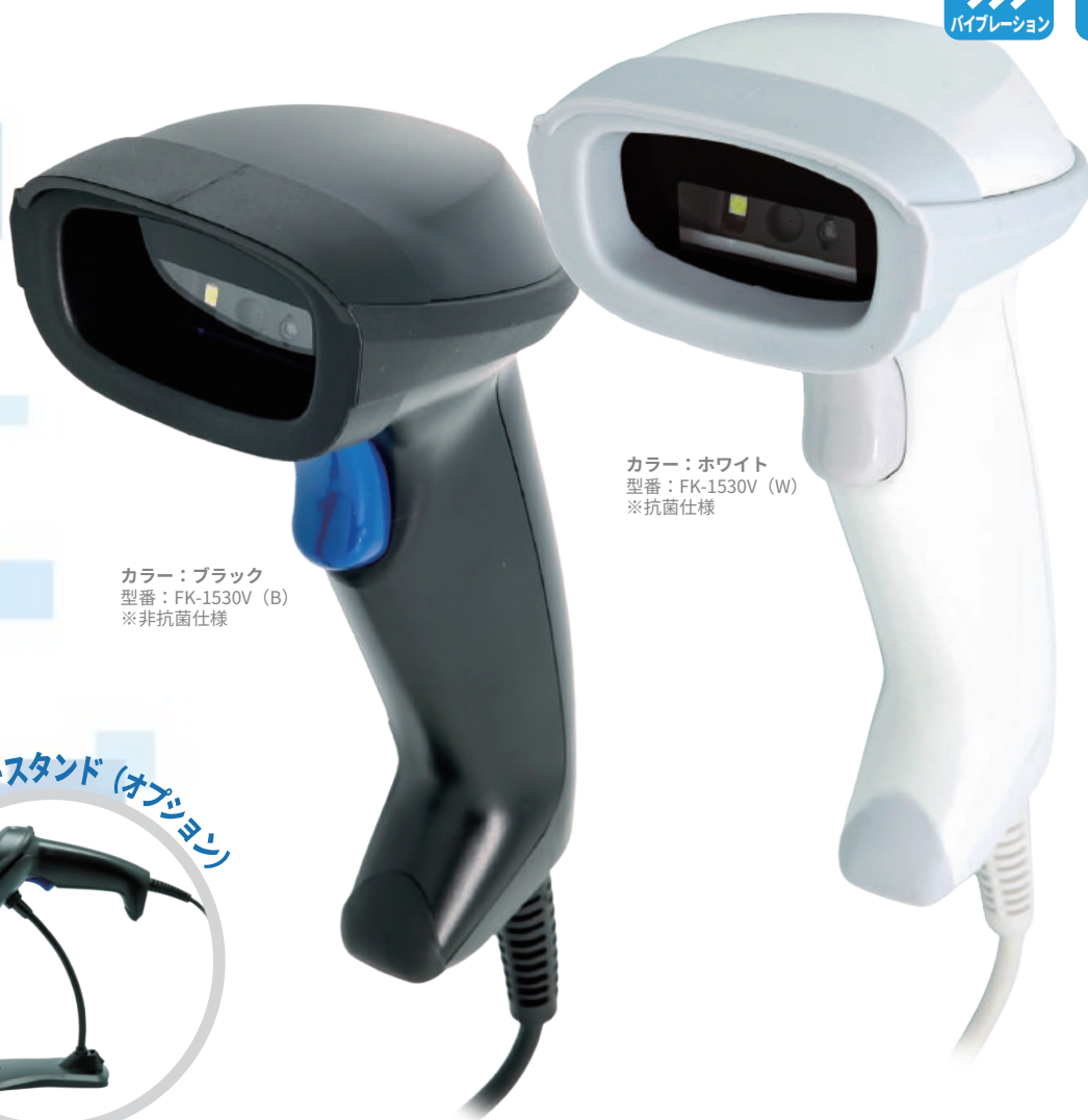
カラー：ブラック 型番：FK-1530V (B) ※非抗菌仕様