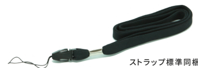
ストラップ標準同梱