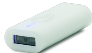
防滴抗菌シリコンジャケット標準同梱